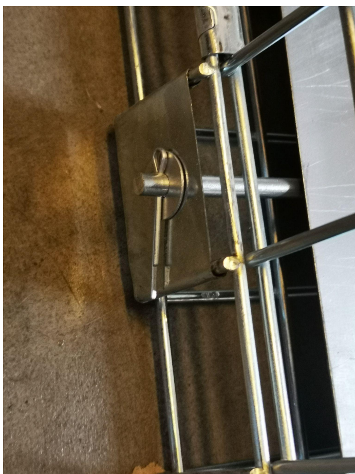
Bilde: trampe plate sikret med en splint og monterings-skive.

På motsatt side av utløsermekanismen skal armen som går fra utløser platen tres igjennom et hull slik at vi kan sikre trampeplaten med en splint og en monterings-skive slik vist på bildet nedenfor.